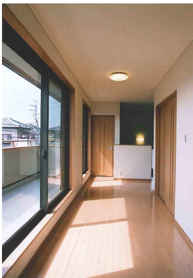
2階廊下 廊下を広くすることで、バルコニーと一体の多目的スペースに利用。