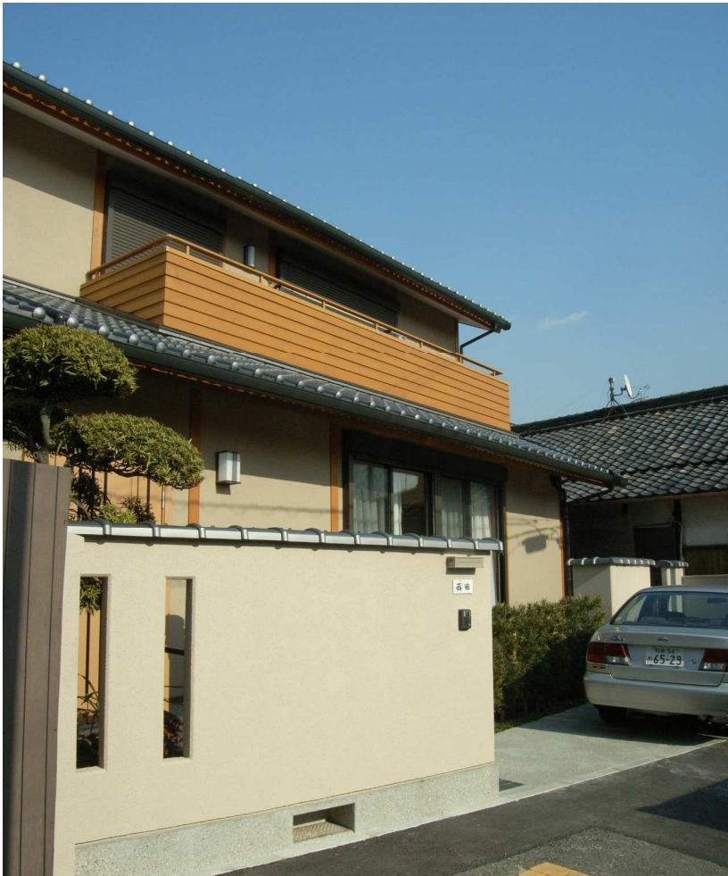
外観 前面道路が狭く道路後退整備した南面全景。2階バルコニーの腰板がアクセント。