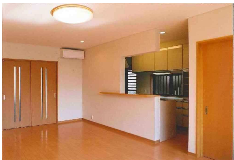
1階居間・食堂・台所 ／キッチン右は2方向から使える食品収納

岸和田市内和瓦の民家が連なる古い町並みに建つ、和風平入りの住宅。お母様の足元を考慮してスロープで居間に直接出入り出来る。内部は車椅子が使えるように、廊下や扉は広めに造られたバリアフリー住宅。