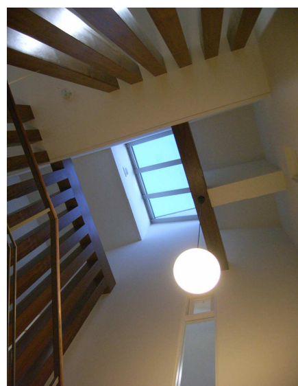
階段室見上げ／最上部の換気システムで熱を排出