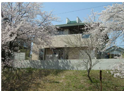
桜並木緑道からの全景

構造 - W+S造 規模 - 地下1階・地上2階建 床面積 - 177.69㎡ 用途 - 専用住宅