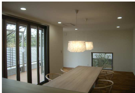
食堂／左側折戸の外はウッドデッキ