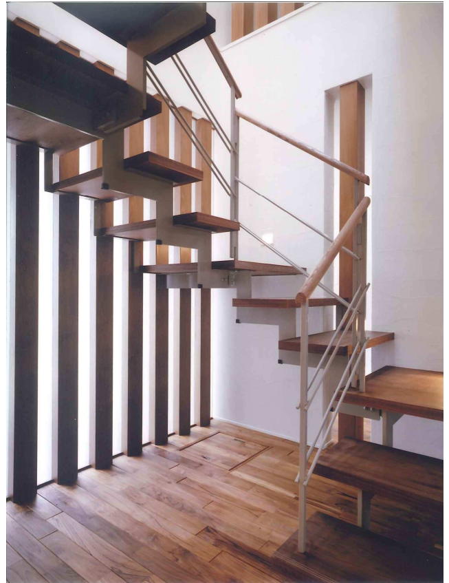
階段室／光井戸・風の道として利用