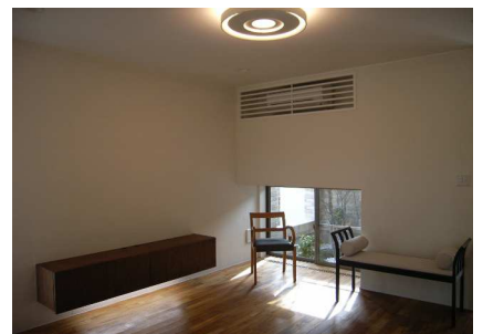
居間／正面窓の外は中庭