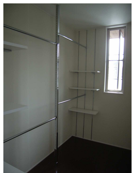
近藤典子システムラック