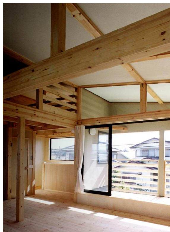
2階子供のための部屋(ロフト付き)