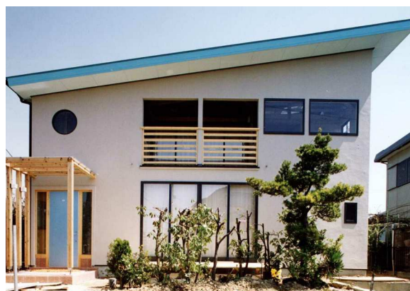
南側全景(屋根は寄棟から片流れに変更)