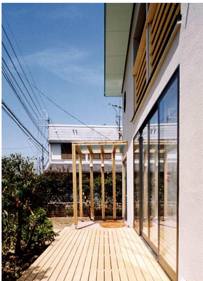
南面テラス(1階居間に続く北面にも同テラスがある)