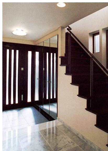
ホールより玄関を見る