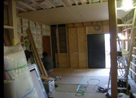
03 内部施工状況(仮養生)