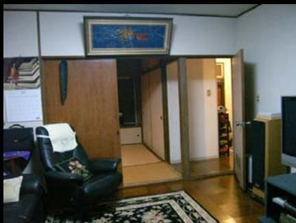
改修前洋室から和室を見る