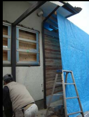
10 外壁バラ板の隙間無し工法(大工さん推奨)