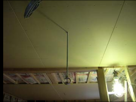
07 サッカーリフティング練習用フック