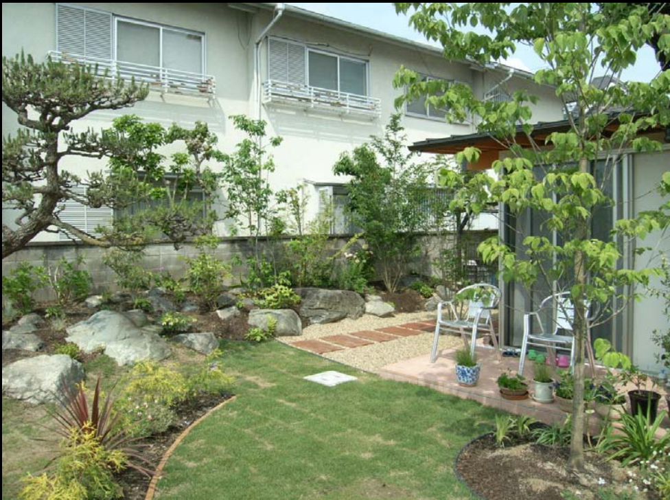
庭より土間ルーム、テラスを見る