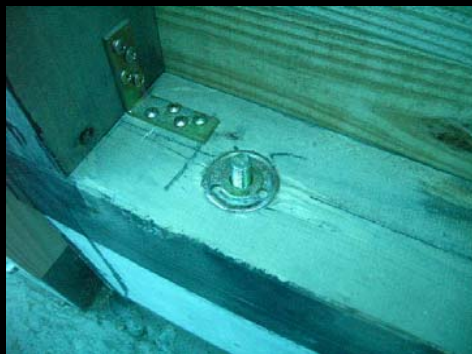
09 土台アンカー緩み防止座金(炭防腐塗り)