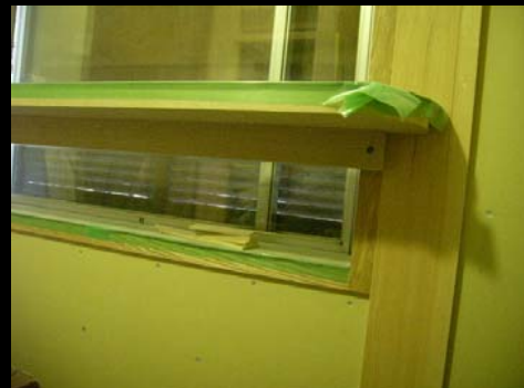
06 ベッド横の棚(サッシ既設)