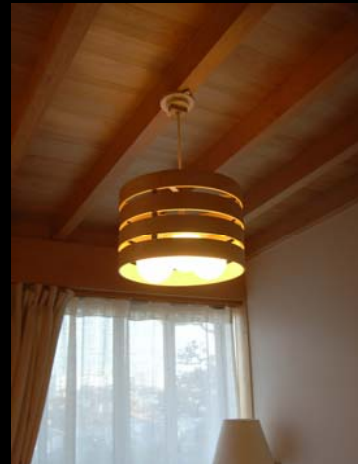
22 持ち込みペンダント照明(ピッタリ)