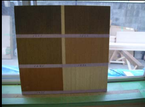
05 塗装カラーの選別(見本塗り)