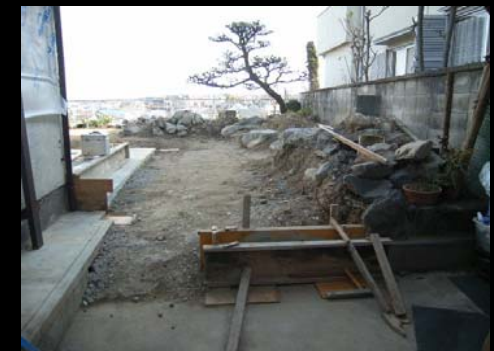
カーポートから工事中の状況