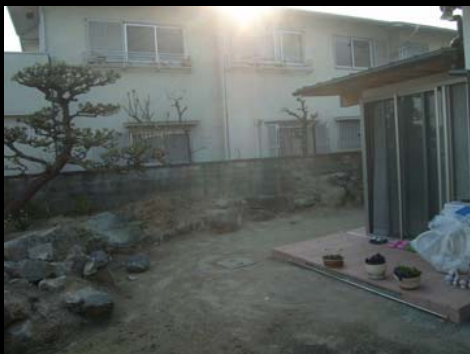
建築工事完成時の状況