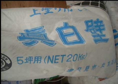
13 内壁漆喰(左官屋さんのこだわり)