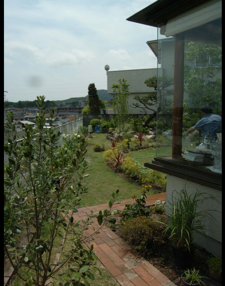
庭全景・右側は第1期増築改修による居間