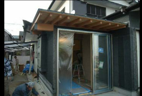
16 増築部引き込みサッシ(既製品)