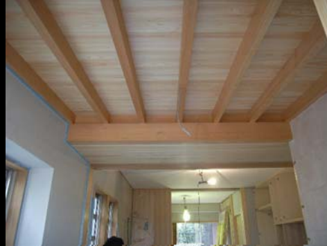
17 増築部屋根現し天井