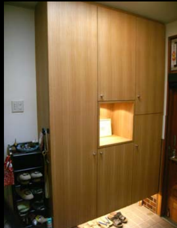
21 玄関収納入れ替え(足元を明るく)