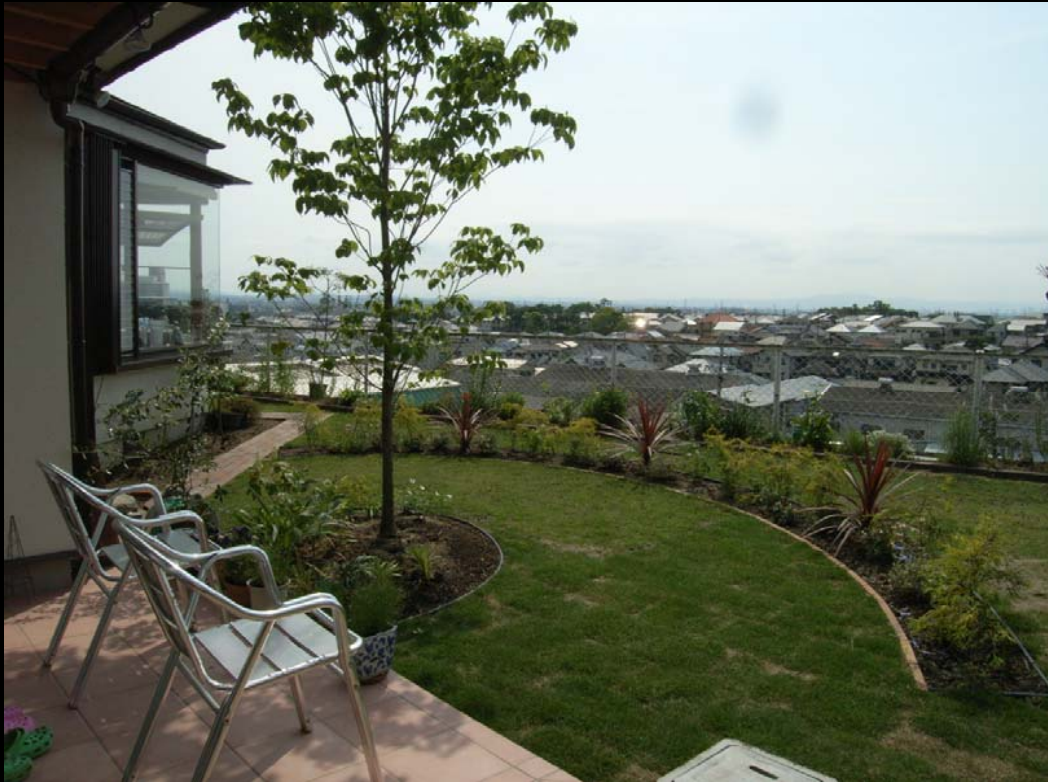
土間ルーム前テラスより(敷地は高台に位置する)