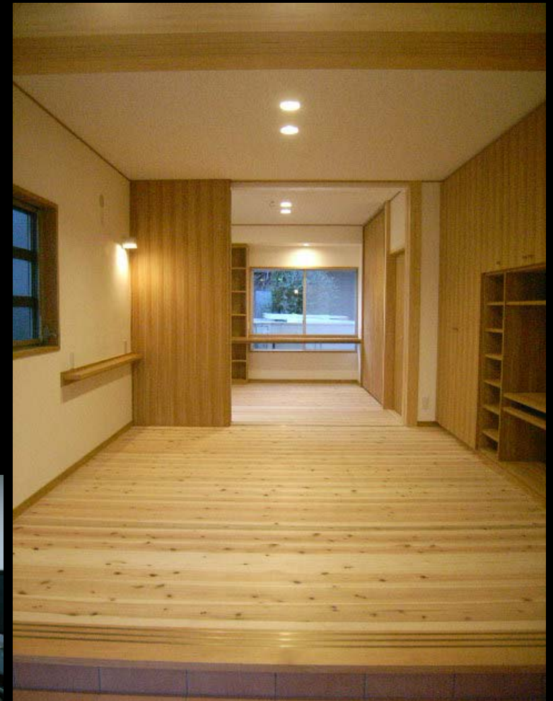
土間ルームより洋室と奥の子供室(元和室)を見る