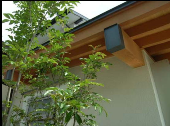
白木と緑はよく似合う