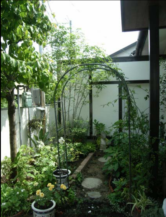
玄関前の庭 奥は倉庫