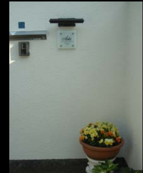
20 表札取替え(施主選定)