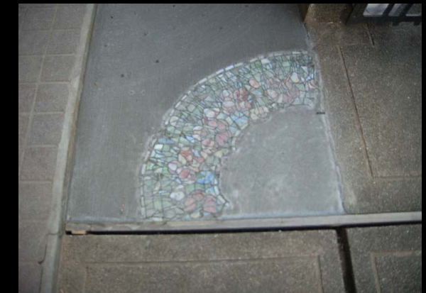
同上廃棄予定の照明スタンドガラスを埋込む(施主施工)