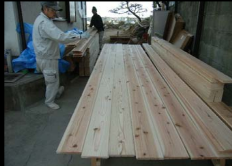
02 床材の選別(はねた板は他で利用)