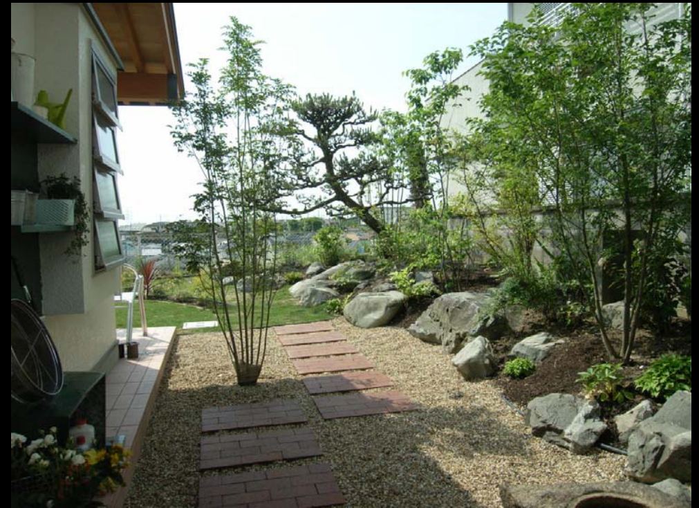
カーポートから 左が土間ルーム