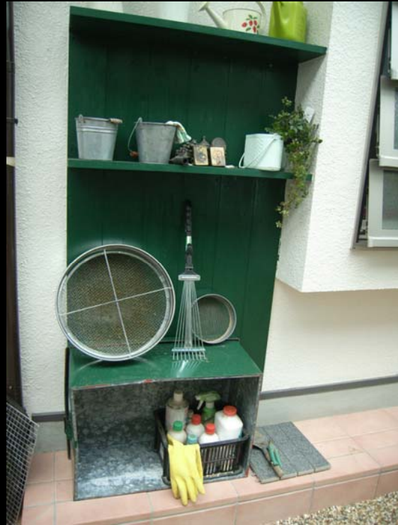
床材で撥ねた板を使った造園棚