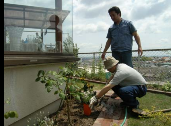
設計者とSAHAメンバーによる植栽のお手伝い