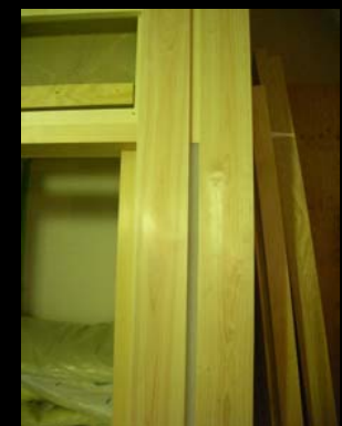
12 柱間に挟んだアクリ板(消し忘れ対策)