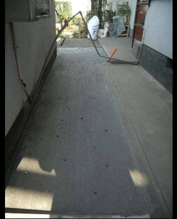
玄関前通路(ビー球を埋め込む)