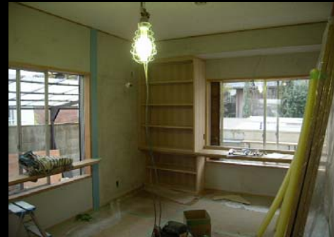
15 内部施工状況(青い柱はご指定カラー)