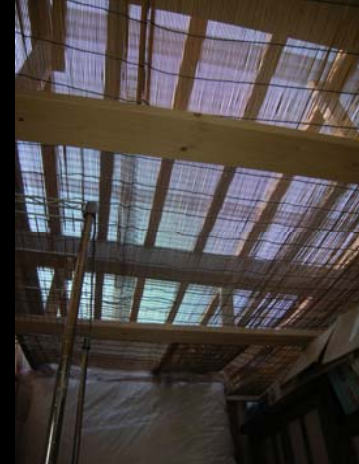
23 すだれを利用した倉庫屋根遮熱(屋根ポリカ)