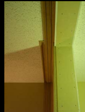
11 アングル金物による鴨居溝